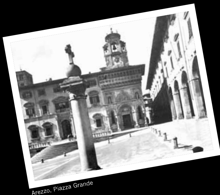
Arezzo, Piazza Grande

TELEFONI DEL COMITATO ORGANIZZATORE 339 8496854 - 347 7956327, tel. 0575 901333 - fax 0575 940436 referente: Isabella Macrì