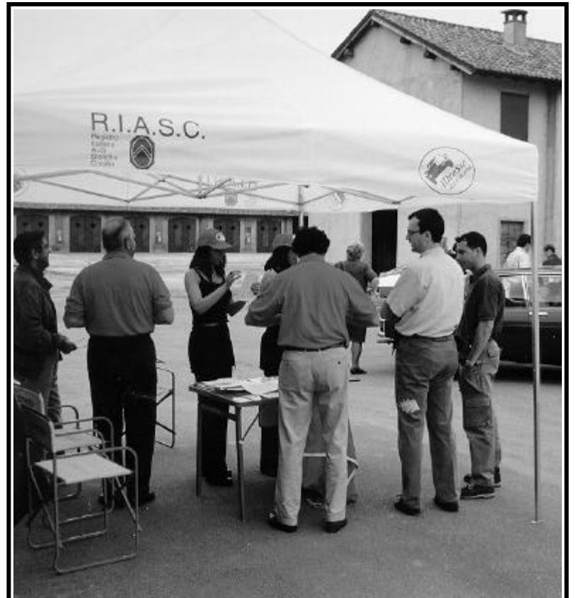
Il RIASC a Vairano lo scorso anno con l'SM Club Italia

continuare a maniche rimboccate perché tutto continui a funzionare.