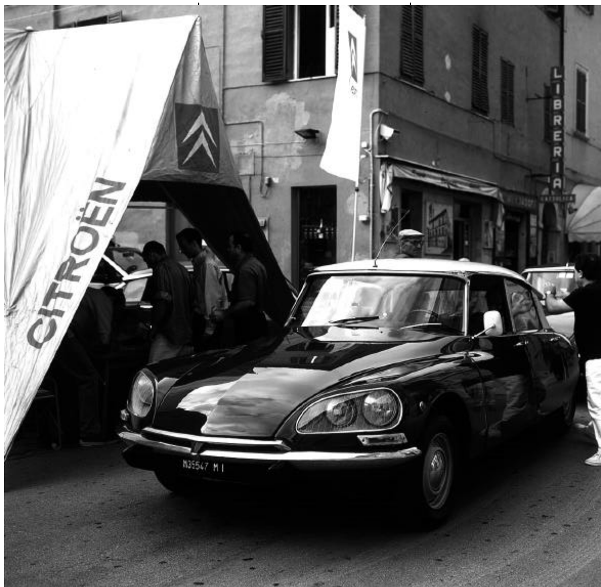
Il tendone Citroën che ospitava la segreteria del Raduno

Dal piazzale dell'Azienda Agricola Monteschiavo, ristorati da un ricco buffet i radunisti nuovamente in colonna sono partiti per il giro dei Castelli di Jesi, attraversando Monte-