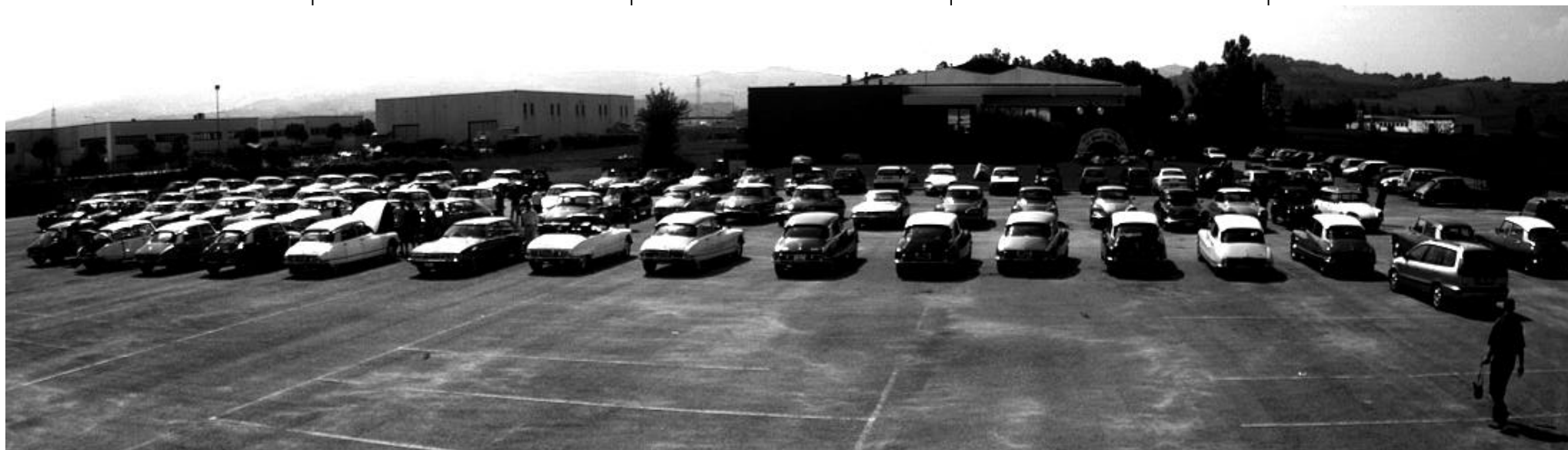
Uno spettacolare colpo d'occhio sul parcheggio del ristorante.

E' allo studio l'ipotesi di allestire un prologo al raduno del Saltino per l'ultimo fine settimana di novembre a Pontassieve in occasione dell'apertura del «vin novo» che con l'«olio novo» vien proprio bene. Informazioni al riguardo sul Foglio Notizie di Ottobre.